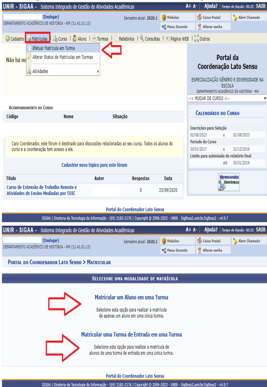
Figura 5 - Matrícula de Estudante em Turma na Especialização